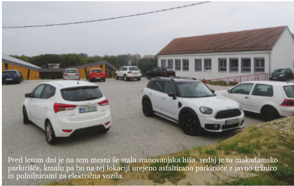
Pred letom dni je na tem mestu še stala stanovanjska hiša, sedaj je tu makadamsko parkirišče, kmalu pa bo na tej lokaciji urejeno asfaltirano parkirišče z javno tržnico in polnilnicami za električna vozila.