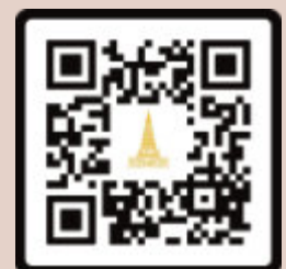
Poglej animacijo Brezzobi tiger

Zgodba na subtilen način mladim bralcem približa ne samo delovanje Državnega sveta in Državnega zbora in njune pristojnosti, temveč tudi pojasnjuje pomembnost upoštevanja drugačnosti za dosego pravične odločitve.