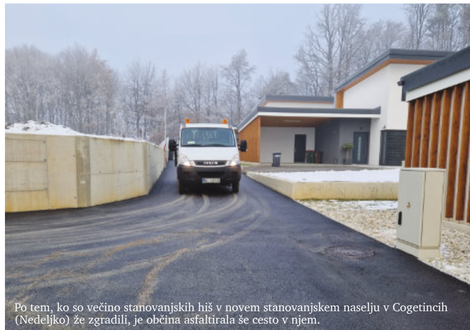
Po tem, ko so večino stanovanjskih hiš v novem stanovanjskem naselju v Cogetincih (Nedeljko) že zgradili, je občina asfaltirala še cesto v njem.