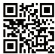
Božično-novoletni koncert v Lokavcu