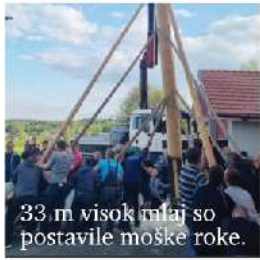
33 m visok mlaj so postavile moške roke.