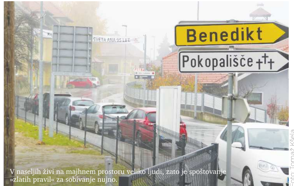
V naseljih živi na majhnem prostoru veliko ljudi, zato je spoštovanje »zlatih pravil« za sobivanje nujno.

Odlok o javnem redu in miru v občini Sveta Ana ima tudi kazenske določbe. Tistim, ki ga ne spoštujejo in jih zalotijo inšpektorji, grozi globa v višini 150 evrov, pravnim osebam v višini 500 evrov, odgovornim osebam pravnih oseb pa v višini 250 evrov.