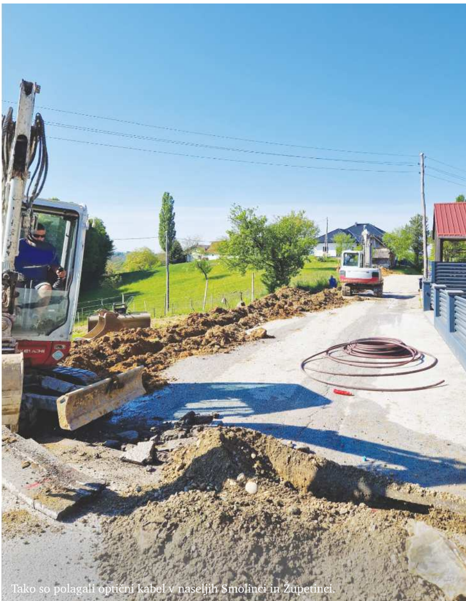
Tako so polagali optični kabel v naseljih Smolinci in Župetinci.