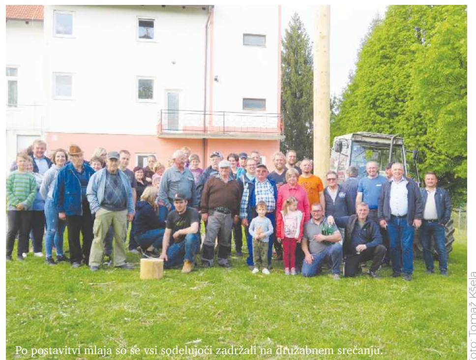
Po postavitvi mlaja so se vsi sodelujoči zadržali na družabnem srečanju.

Že pred leti je bilo na letalskem dnevu v Cerkevjak mogoče videti mini helikopter, s katerim je iz Celovca na avstrijskem Koroškem priletel eden od letalskih zanesenjakov. Morda bo priletel tudi letos.