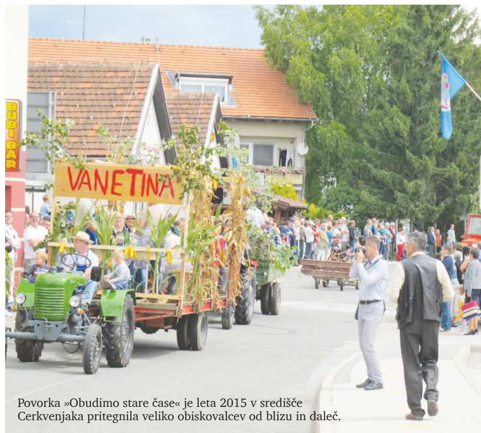
Povorka »Obudimo stare čase« je leta 2015 v središču Cerkevjak pritegnila veliko obiskovalcev od blizu in daleč.

Društvo vinogradnikov in ljubiteljev vina Cerkevjak in Društvo kmečkih deklet in žena bosta tudi letos pripravila večer in razstavo »Vino in kulinarika«, ki vsako leto pritegne številne obiskovalce, ki cenijo domače dobrote. Društvo Krdebač bo pripravilo Rimski tabor pri Lübi vodici, Društvo general Maister pa pohod po severni meji Cerkevjak. Kulturno društvo Cerkevjak bo skupaj z drugimi društvi organiziralo srečanje »Pod lipo samostojnosti« s kulinaricnim pridiom, Športno društvo »Rekreativno kolesarjenje« in Društvo upokojencev »Srečanje ljudskih pevcev«. Poleg tega bo v okviru praznika še več športnih, kulturnih in drugih prireditev, ki se bodo končale s tradicionalno košnjo trave in grabljanjem v organizaciji turističnega društva. Na prireditvah v okviru občinskega praznika občine Cerkevjak lahko vsakdo najde nekaj zase.