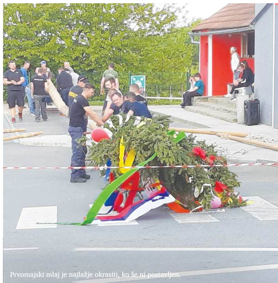
Prvomajski mlaj je najlažje okrasiti, ko še ni postavljen.

Sicer pa je bilo po podatkih Statističnega urada Republike Slovenije v občini Sveta Ana lani 2.336 prebivalcev, od tega je bilo delovno aktivnih 828. Zaposlenih je bilo 339, samozaposlenih pa 166. Povprečna plača zaposlenih Ančank in Ančanov je lani znašala 1.761 evrov bruto oziroma 1.153 evrov neto – to je predstavljalo 91,8 odstotka povprečne neto plače v Sloveniji.