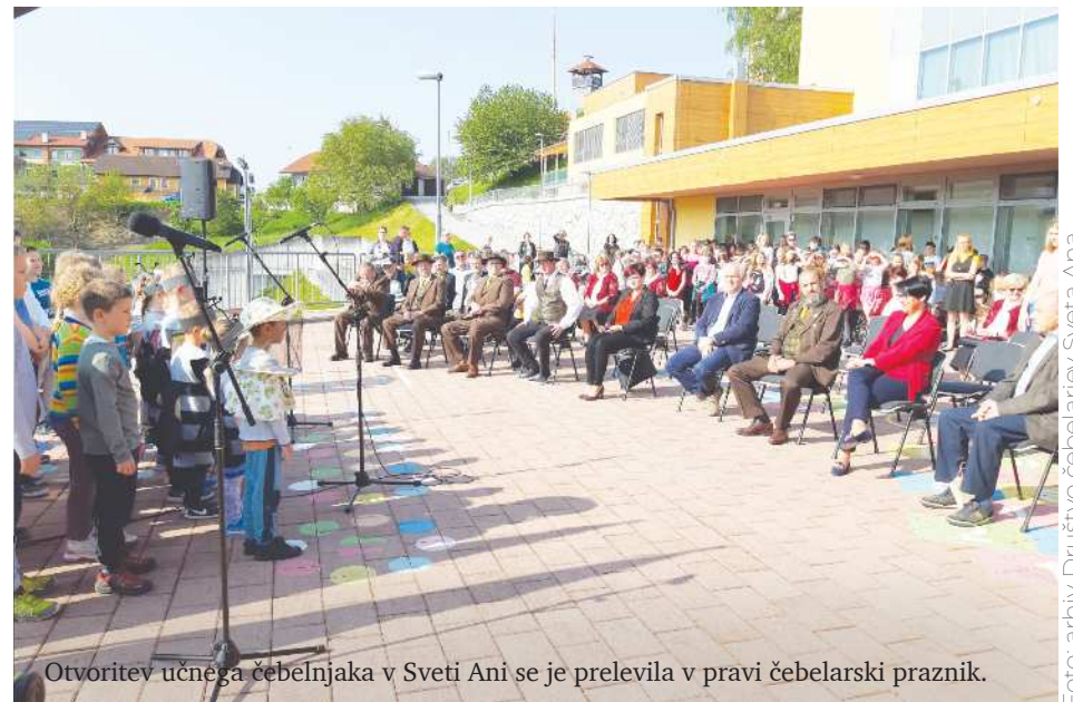
Otvoritev učnega čebelnjaka v Sveti Ani se je prelevila v pravi čebelarški praznik.