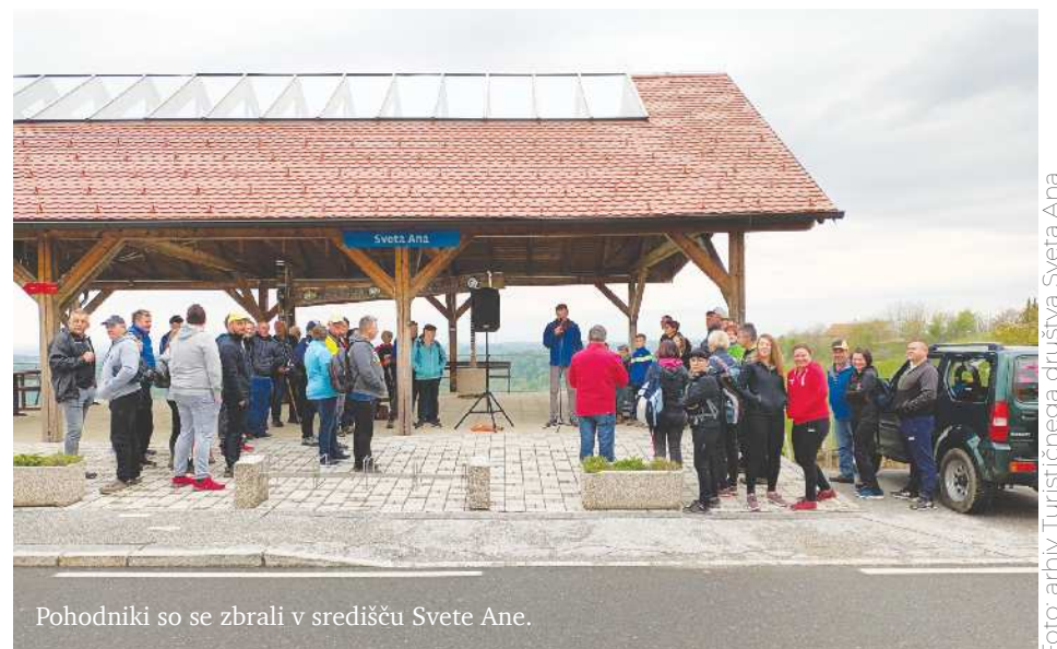
Pohodniki so se zbrali v središču Svete Ane.