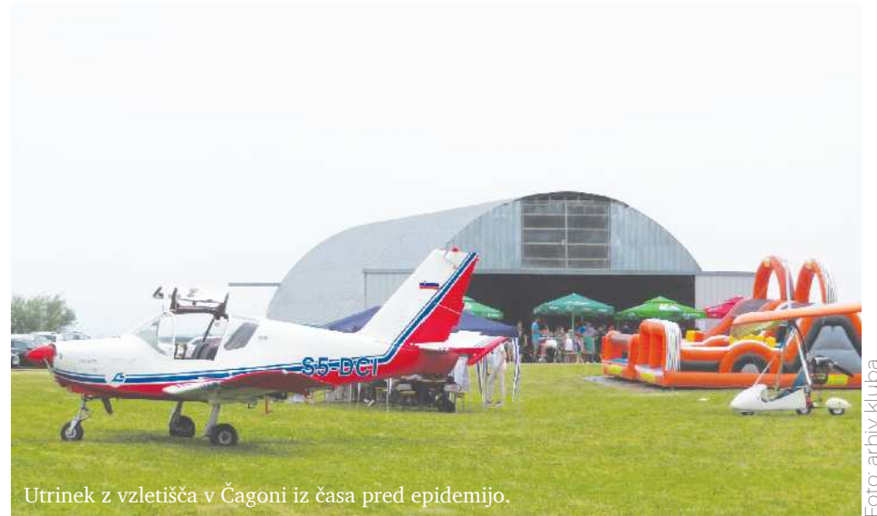
Utrinek z vzletišča v Čagoni iz časa pred epidemijo.

Na vzletišču v Čagoni v neposredni bližini Cerkevjak bo 18. junija 11. Letalski dan Aerokluba Sršen iz Cerkevjak. To je priložnost za srečanje in izmenjavo izkušenj vseh, ki jih v osrednjih Slovenskih goricah in tudi širše, prek naših meja, zanimata letalstvo in še zlasti njegov razvoj. Če bo letalski dan v Cerkevjak letos ponovno obiskalo toliko pilotov z letali ter zmajarjev, modelarjev in drugih ljubiteljev letalstva kot v časih pred epidemijo covid, kar je mogoče pričakovati, bo na vzletišču v Čagoni veliko obiskovalcev.