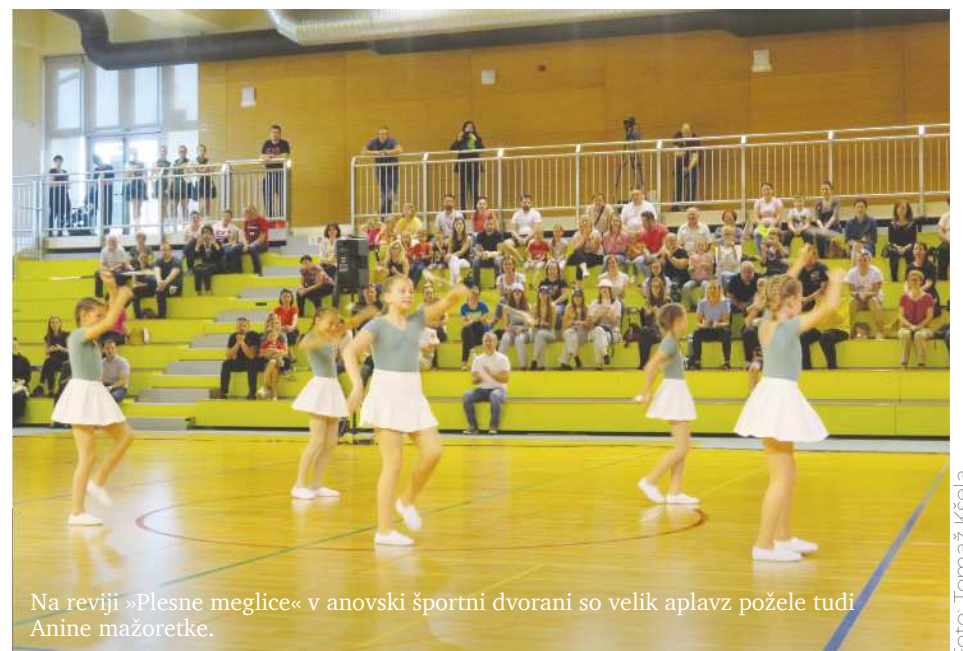
Na reviji »Plesne meglice« v anovski športni dvorani so velik aplavz požele tudi Anine mažoretk.

Slavnostno otvoritev učnega čebelnjaka so popestrili s kulturnim programom, ki so ga izvedli otroci in učenci iz osnovne šole v Sveti Ani in podružnične šole v Lokavcu ter ljudske pevke Etnološko-turističnega društva Sveta Ana.