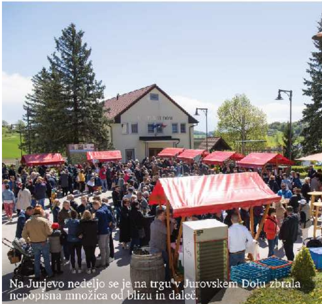
Na Jurjevo nedeljo se je na trgu v Jurovskem Dolu zbrala nepopisna množica od blizu in daleč.