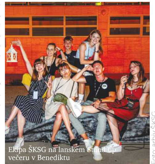
Ekipa ŠKSG na lanskem stand up večeru v Benediktu

Mi že komaj čakamo na poletne projekte, kaj pa vi?