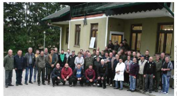
Tradicionalnega srečanja gasilcev in lovcev se je udeležilo več kot 50 članov in se je odvijalo v lovskem domu in v njegovi okolici. Pokal so tudi letos, kot leta 2019, prevzeli lovci.