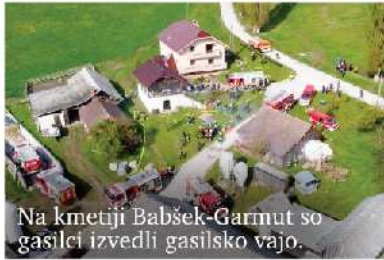
Na kmetiji Babšek-Garnut so gasilci izvedli gasilsko vajo.