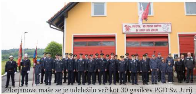
Florjanove maše se je udeležilo več kot 30 gasilcev PGD Sv. Jurij.