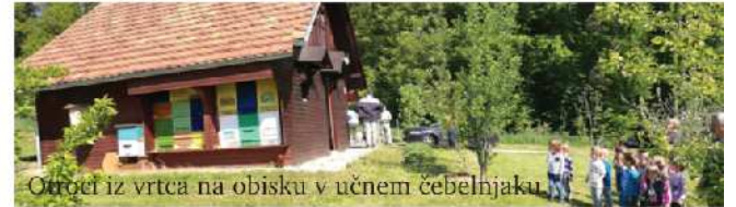
Ortoči iz vrta na obisku v učnem čebelnjaku.